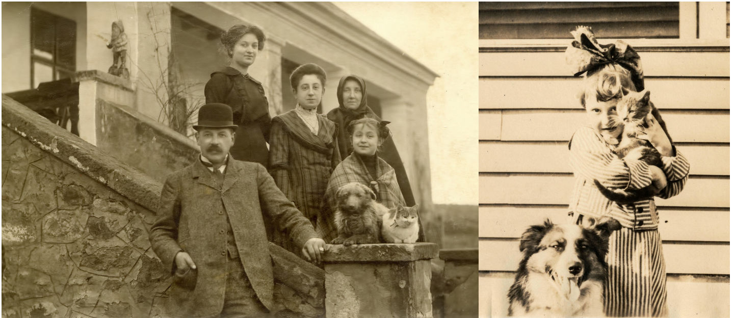
Les animaux domestiques ont toujours fait partie du quotidien des Français, posant même sur les photographies de familles, étant considérés comme des membres à part entière.