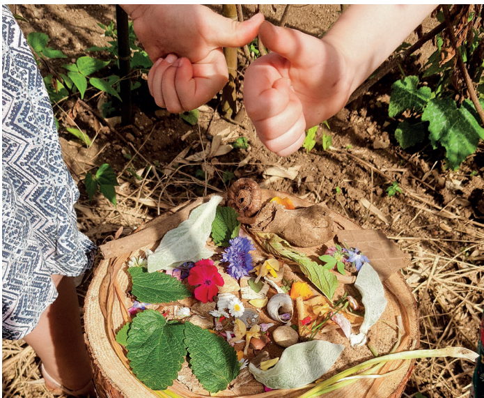
Activité Land Art avec les élèves du périscolaire.